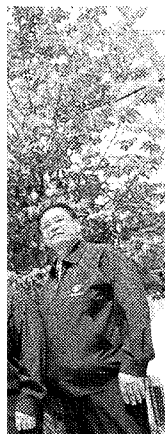
の、会 北区 年から 手風親 つ仕事 場所が た」と ケツた のため 、1場 目ほ り上 が った。