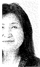
城大学外国語学部教授

を結ぶ共通語として重要性を増している。学習指導要領の改訂により、小学校から英語教育が本格化したのが、通常の言語習得には約